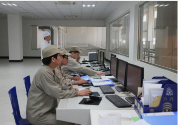
Kontrollzentrum in einem Granulatherstellungsbetrieb in der Provinz Jiangsu für die Inprozesskontrolle

Unter dem marktläufigen Begriff „Granulate“ in TCM-Kreisen versteht man industriell hergestellte Trockenextrakte von Einzeldrogen. Diese werden analog zu „Yin Pian“ (Dekoktstück) nach individuellen Rezepten gemischt, mit heißem Wasser aufgebriht und als moderne Form von Dekokt eingenommen. Statt Aufbrühen können sie aber auch zu Tabletten gepresst oder eingekapselt werden.